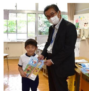
中元寺小学校にて