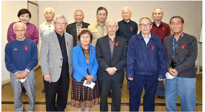
(写真)添田町老人クラブ連合会地区会長のみなさん