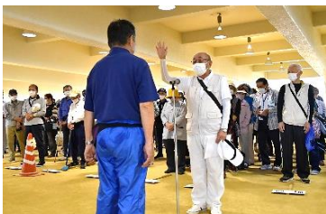
選手宣誓（上庄地区）