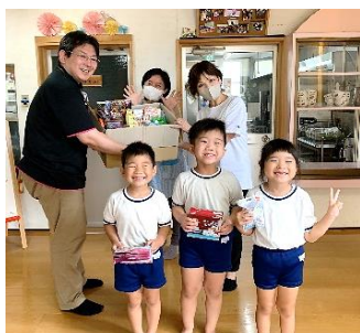
真木保育園さんへ

各家庭で使い切れない未使用食品や、食べきれなかった食品を持ち寄ってフードバンク団体などに寄贈する活動です。セブン・イレブン・ジャパンは全国27拠点でフードドライブ活動を実施。集められた支援品は各地域の社会福祉協議会を通じて支援が必要な方へ提供している。