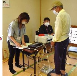
体脂肪率・骨格筋量測定