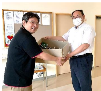
救護施設なのみさんへ

セブンイレブン様から頂いた支援品は社協と連携している法人間ネットワークの施設、保育園等に配布させていただきました。