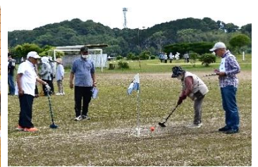
グラウンドゴルフの様子