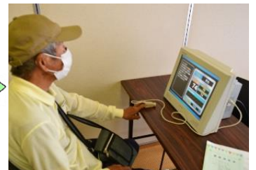
血管年齢・ストレスチェック